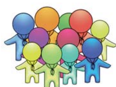
Pfadfinderarbeit in Diözesanverbänden