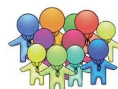
Pfadfinderarbeit in Diözesanverbänden