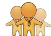
Pfadfinderarbeit in Bezirken