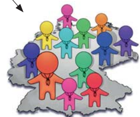
Pfadfinderarbeit im Bundesverband