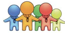
Pfadfinderarbeit in Stämmen und Siedlungen